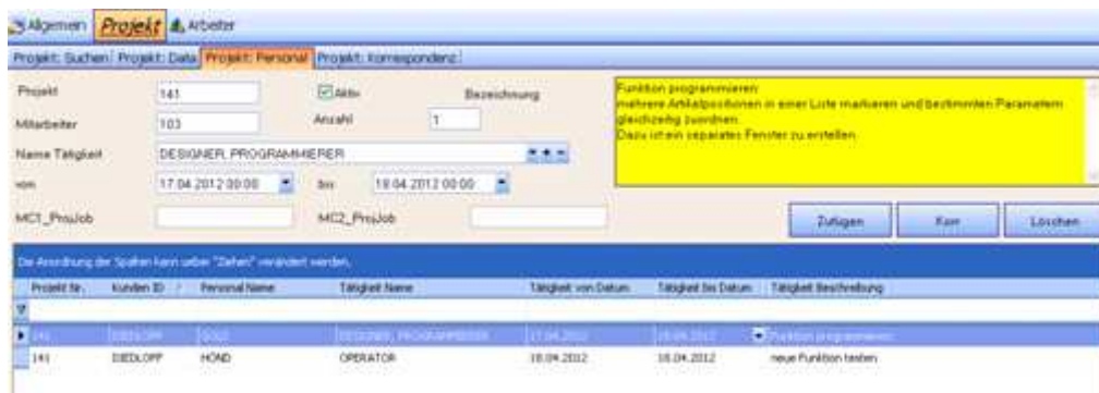
Beispiel: Zuweisung von Personal mit Tätigkeit und Arbeitsdauer

In diesen vier Fällen ordnet das System automatisch einen jeweils entsprechenden Status dem betreffenden Angebot, Auftrag oder Lieferschein zu. Der Anwender kann aber dem Projekt einen anderen beliebigen Status zuordnen. Damit ist eine höchstmögliche Flexibilität gewährleistet.